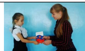
День конституции Российской Федерации - значимый праздник всей страны

День конституции России, который ежегодно отмечается 12 декабря , один из главных государственных праздников в нашей стране. Конституция определяет направление развития государства и права и обязанности каждого гражданина страны. Во всех классах просмотрели видеофильмы и презентации на тему: « День конституции Российской Федерации »